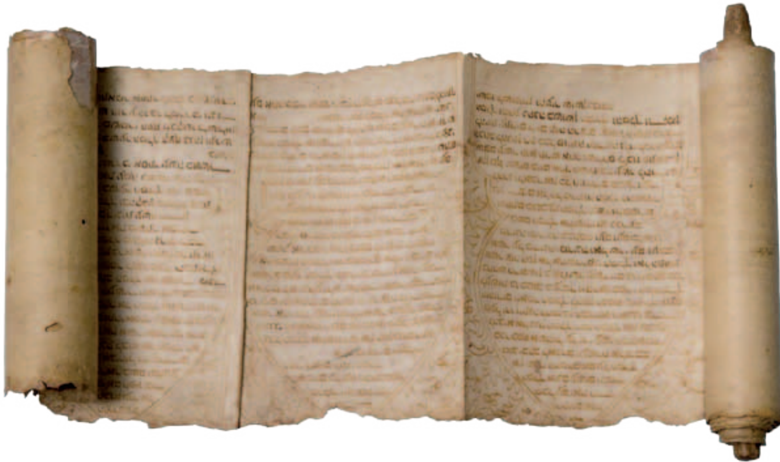
Rouleau d'Esther, Megilat. Fès (1800).